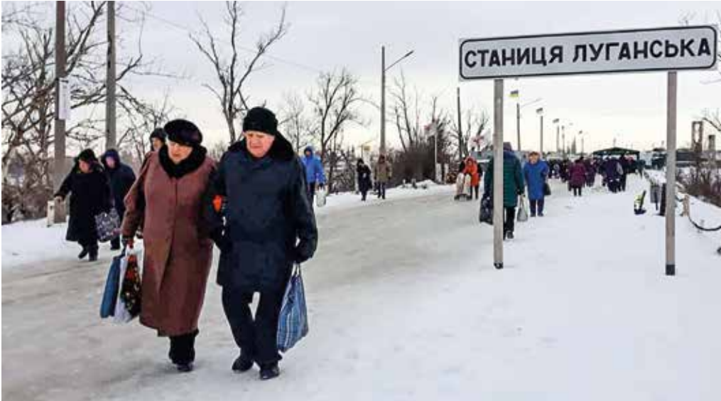
Lokale ukrainere vandrer over kontaktlinjen for at hæve pension og besøge familien. Hver dag sker der brud på våbenhvilen i den væbnede konflikt mellem ukrainere og pro-russiske separatister.