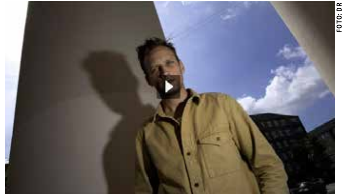
▲ Fra udsendelsen "Det vidste du ikke om Danmark – Politiklager".

Samtidig bruges de pårørendes savn og udlægning af begivenhederne som løftestang og identifikationen i programmet kritik af klagesystemet og DUP'en. De står stort set uimodsagt og fungerer reelt som partsindlæg. Samlet bliver