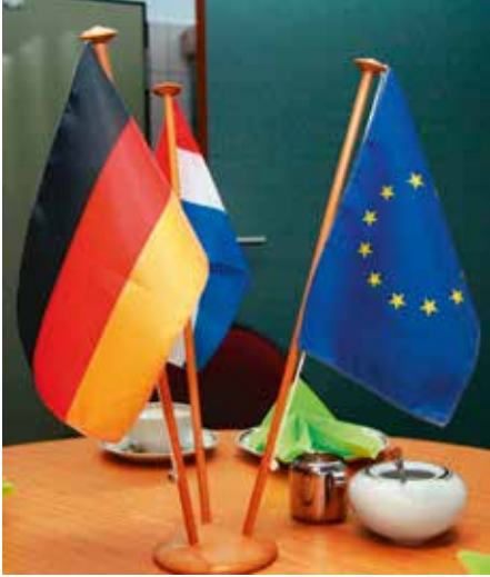
Det hollandske, tyske og EU's-flag side om side på kaffebordet på politistationen i Bad Bentheim. Her danner et effektivt grænsesamarbejde mellem hele fem myndigheder skole for resten af Europa.